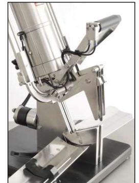
Ergonomische Bedienelemente Ergonomic operating elements