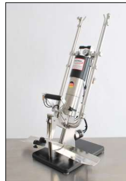
Einfaches Handling Schnelle Reinigung Easy handling - fast cleaning