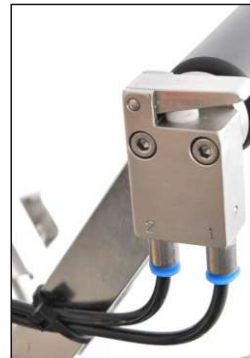
Messerauslösung in VA Knife release in stainless steel