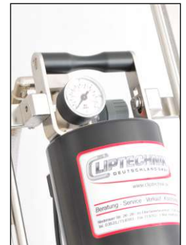
Das Wichtigste stets im Blick The main thing in your sight