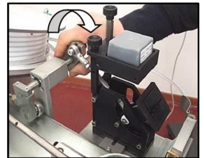
Drucker für Kennzeichnung