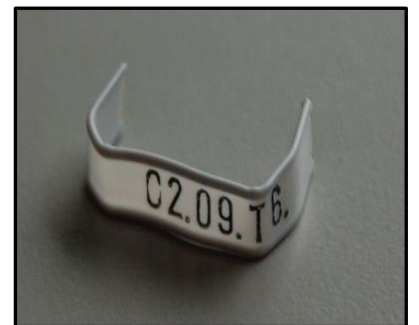
Einfach • Schnell • Sicher